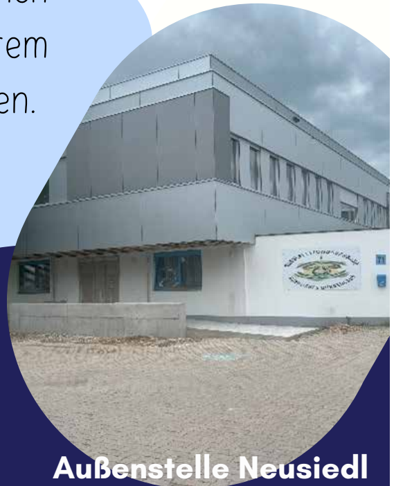
Außenstelle Neusiedl Wiener Straße 71 7100 Neusiedl / See