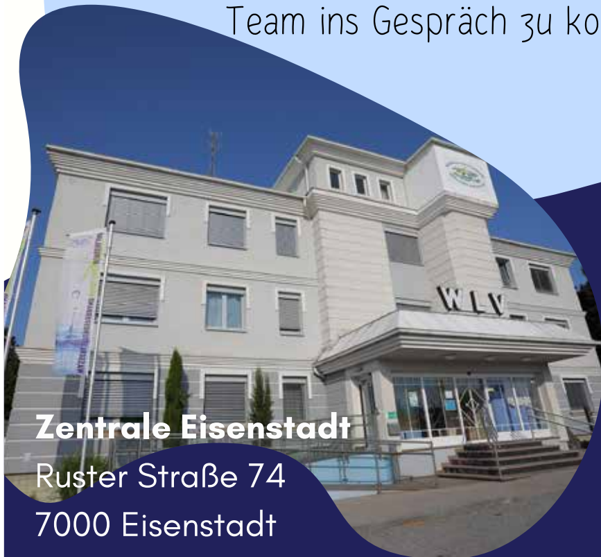
Zentrale Eisenstadt Ruster Straße 74 7000 Eisenstadt